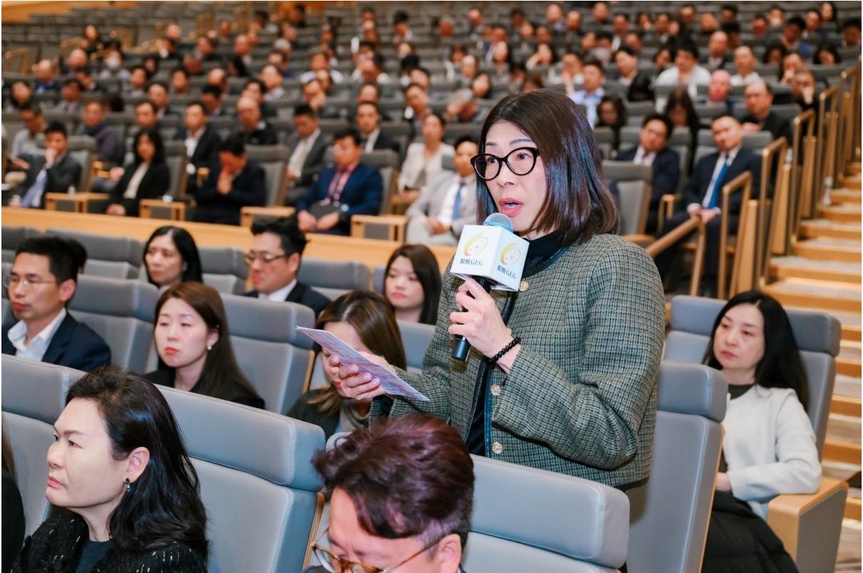
P008：分享會問答環節上，銀娛管理層成員踴躍向多位主講嘉賓提問，現場交流氣氛熱絡，眾人倍感受益。