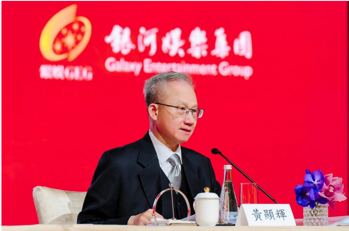
P002：全國人大代表黃顯輝先生分享對今屆「兩會」的心得體會。