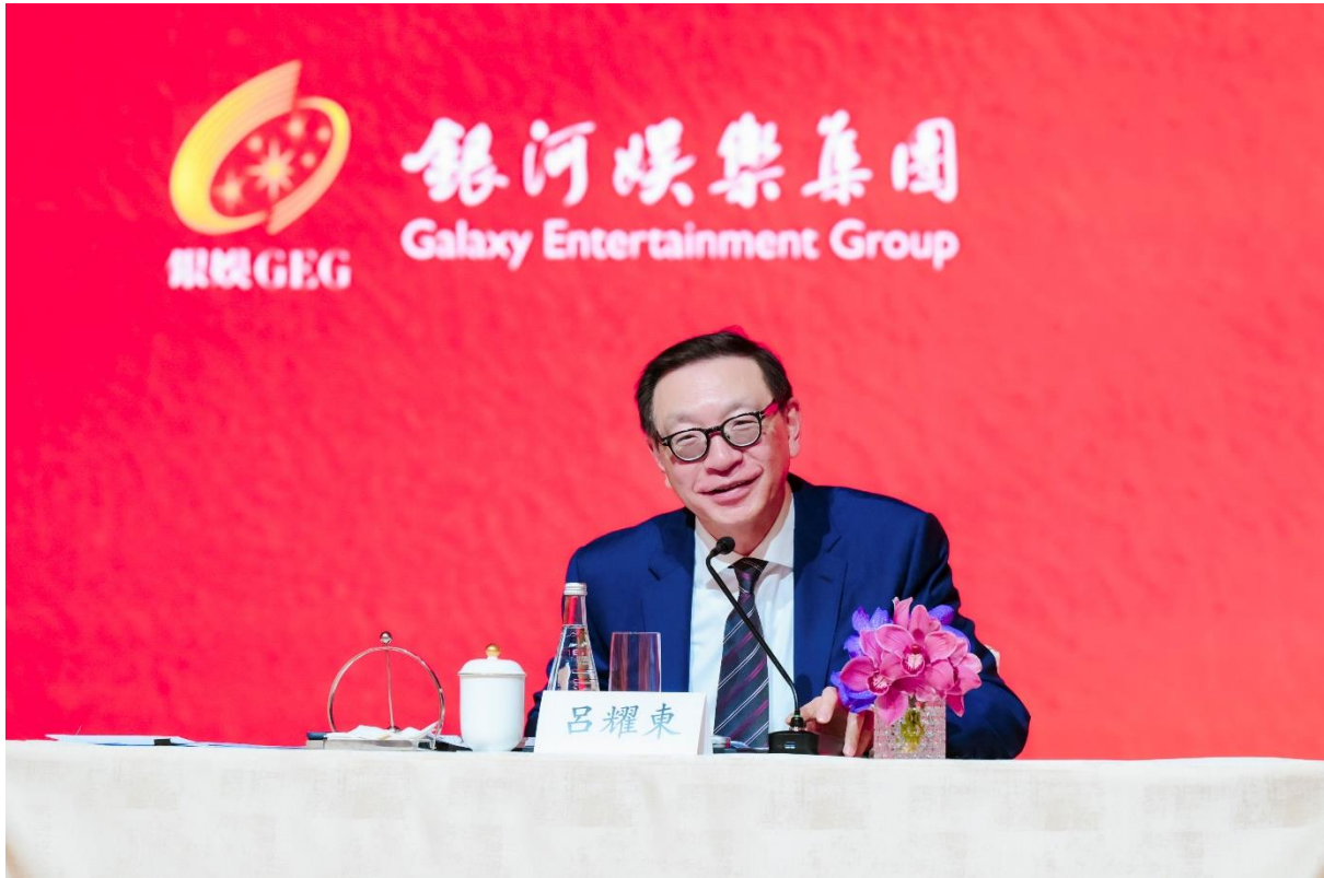
P005：全國政協委員、銀娛主席呂耀東先生分享參與今屆「兩會」心得。