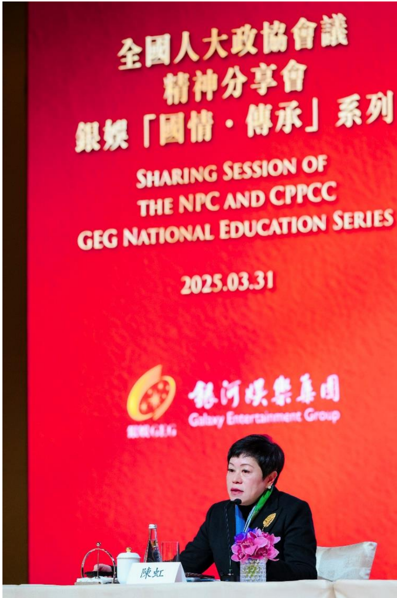
P003：全國人大代表陳虹女士分享參加今屆「兩會」的經驗和感悟。